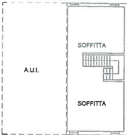
PIANO SECONDO HM=2.35