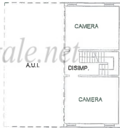
PIANO PRIMO H=2.40