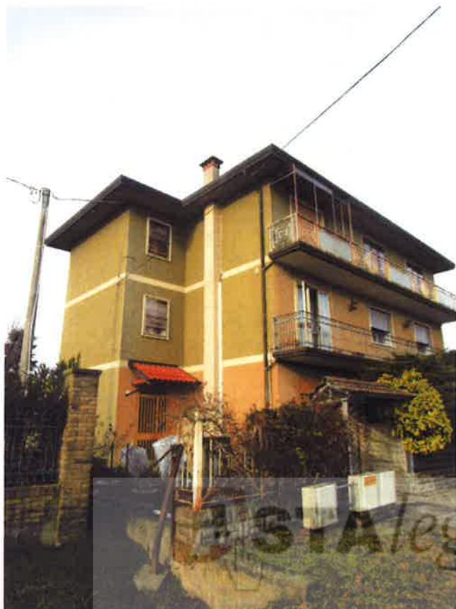
Foto 1 e 2 – Vista del fabbricato condominiale dalla strada pubblica