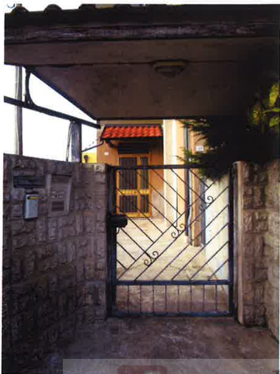
Foto 3, 4, 5 e 6 – Vista accesso dalla strada e vano scala comune