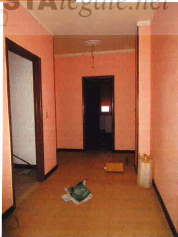
Foto 8 Il disimpegno notte