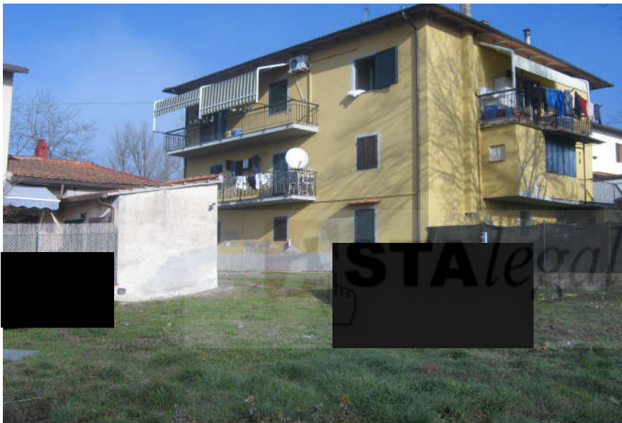
FOTO 2 – 364/10 Resede , Terreno P.IIa 134 - 385