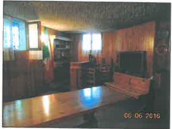
26. Taverna con caminetto