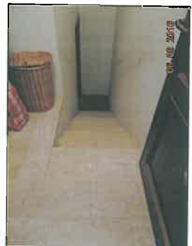
18. Scala al piano seminterrato