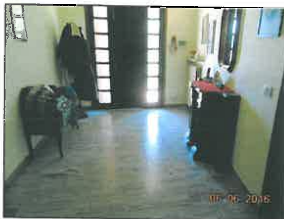
8. Ingresso principale