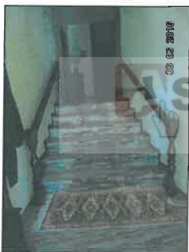
9. Scala al piano rialzato