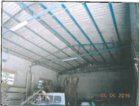
31. Interno deposito