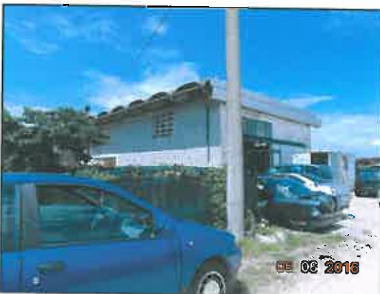
36. Laboratorio sub 3