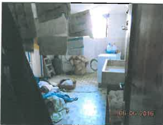
23. Lavanderia - C.T.