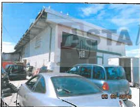
39. Esterno laboratorio