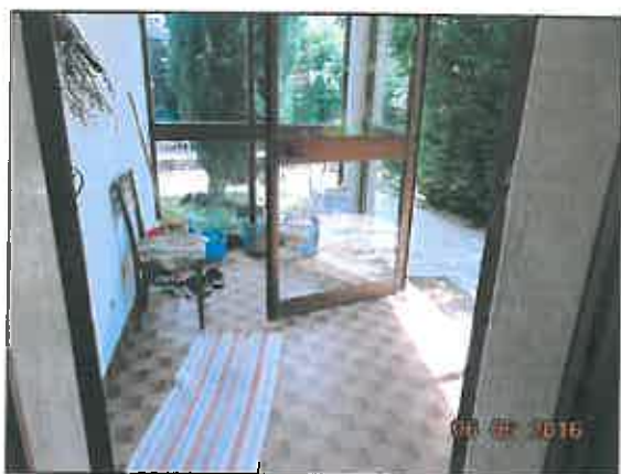
5. Portico di ingresso (veranda)