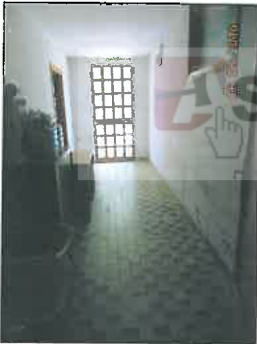
21. Ingresso secondario