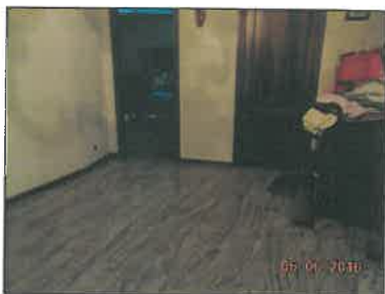
11. Disimpegno al piano rialzato