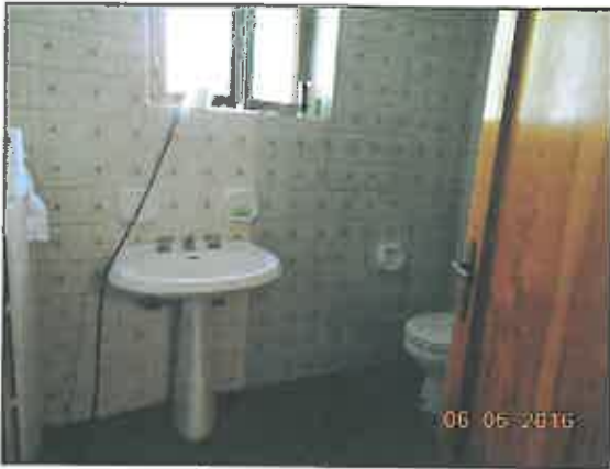
19. Servizio piano seminterrato