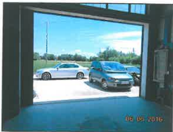
41. Portone di accesso