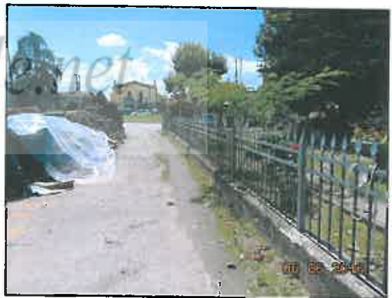
28. Recinzione lato Ovest