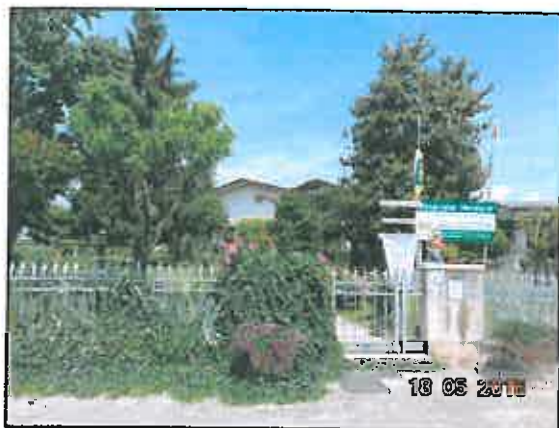
1. Ingresso pedonale alla villa