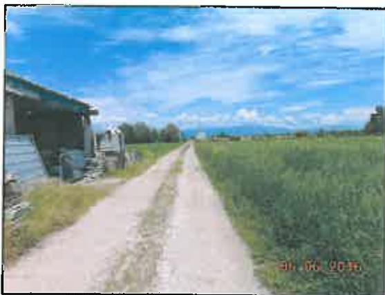
37. Strada vicinale di accesso esterno