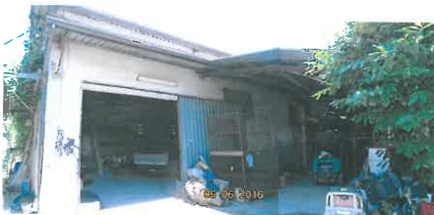
29.-30. Deposito a struttura in acciaio (sub 2)