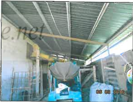
34. Tettoia esterna