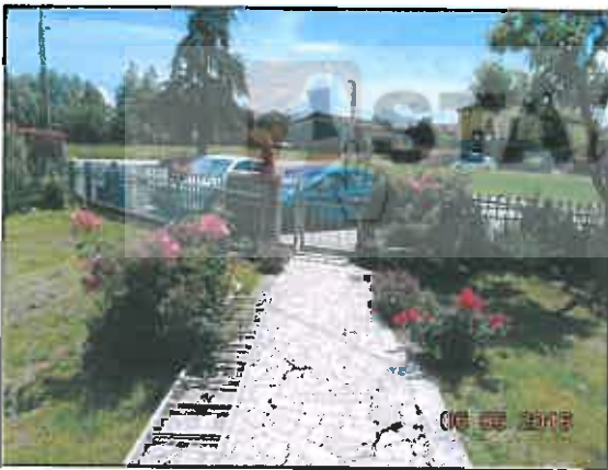
27. Vialetto di accesso alla villa